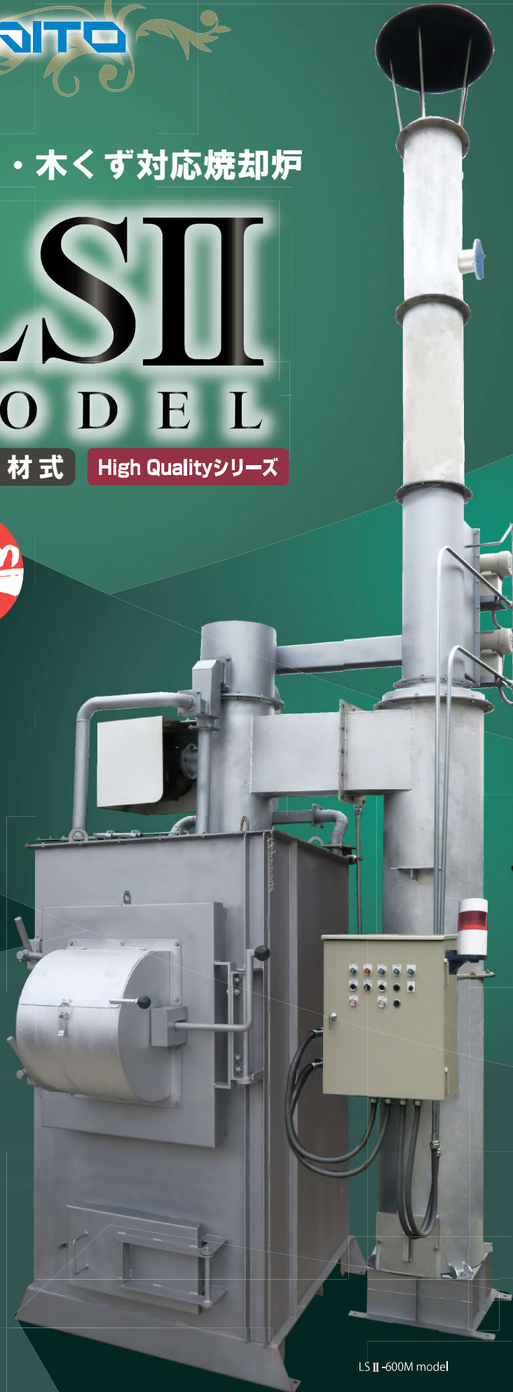
LS II-600M model